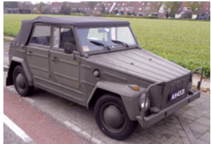
Foto: Joost J. Bakker from IJmuiden - Volkswagen 181 Kurierwagen/Uploaded by Oxyman, CC BY 2.0

Als simples Mehrzweckfahrzeug für Militär und Behörden entwickelt, wurde er ab 1969 auch zivil verkauft und rutschte vom Zweckauto direkt ins Kultregal. Strand, Abenteuer, Individualismus statt Chrom und Status. Ungefiltertes Fahrgefühl, mit einem eher funktionalen als dichtem Verdeck und im Gelände oft erstaunlich zäh. Technisch steckt bewährte Käfer-Basis drin: meist luftgekühlter 1,5 bis 1,6 Liter Boxer Motor mit etwa 40 bis 48 PS, 4-Gang-Schaltung, Heckantrieb und rund 110 km/h Spitze.