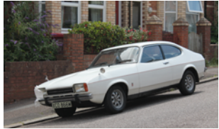
Foto: Charlie from United Kingdom - 1974 Ford Capri II 2000 GT, CC BY 2.0

Der Ford Capri I 2000 GT war Fords Antwort auf den Traum vom erschwinglichen Sportcoupé. Lange Motorhaube, kurzes Heck und ein selbstbewusstes Auftreten machten ihn zum „europäischen Mustang“. Der 2,0-Liter-Vierzylinder bot ordentliche Fahrleistungen (in 11,5 Sekunden von 0 auf 100 km/h) kombiniert mit klassischem Heckantrieb und sportlicher Abstimmung. Viele Capri wurden im Alltag nicht geschont und dabei verschlissen, was gut erhaltene Exemplare heute selten macht. Deshalb gilt der 2000 GT inzwischen als begehrter Klassiker mit spürbar gestiegenem Sammlerinteresse.